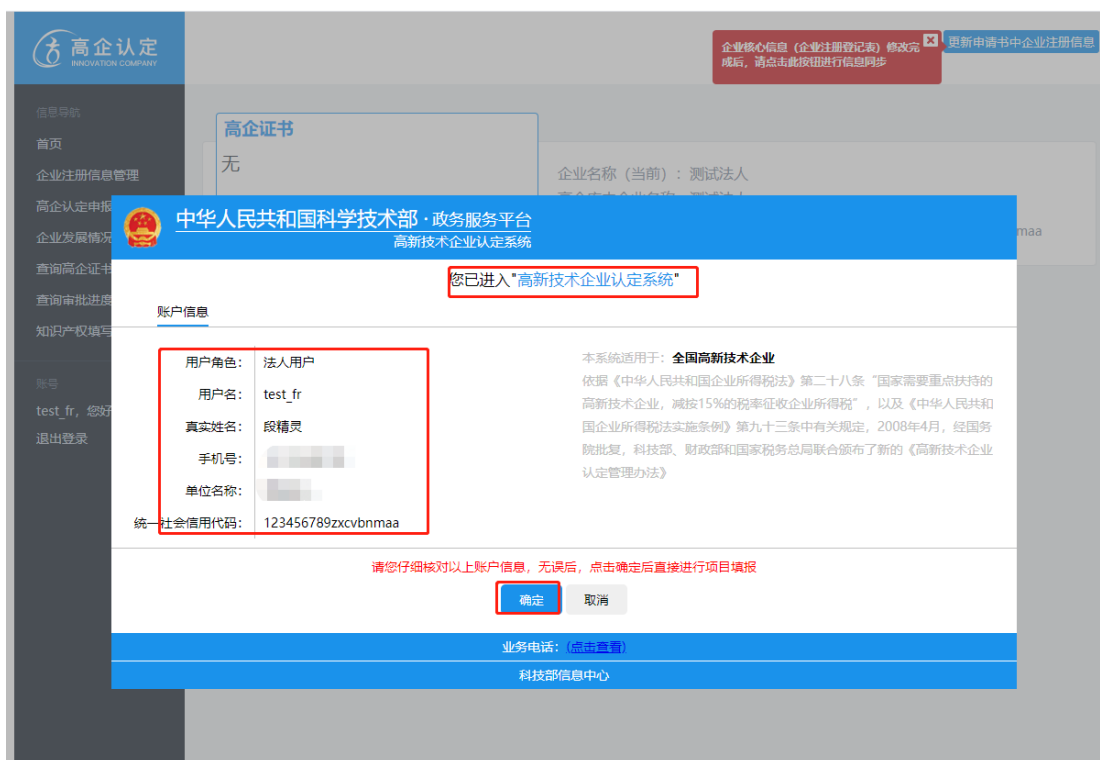
高新技术企业认定系统